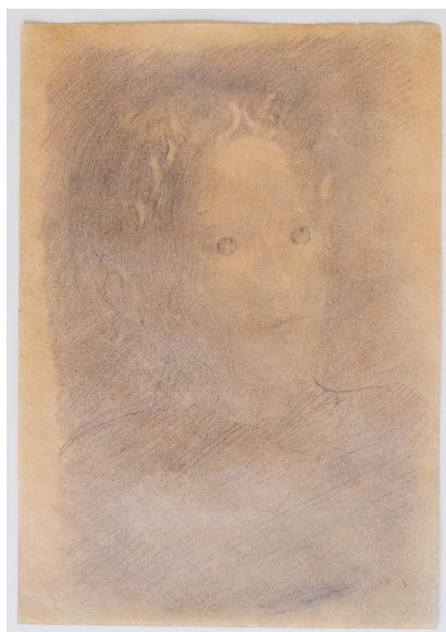
Otto Meyer-Amden, Knabenportrait , c. 1922