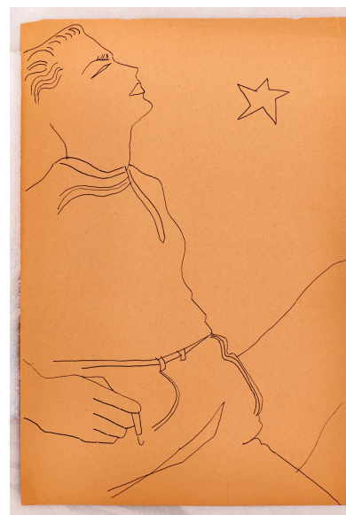
Andy Warhol, Seated Male , c.1954