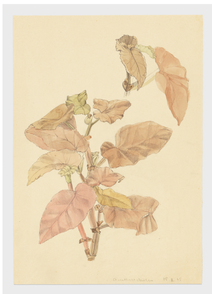
Heidi Bucher, Untitled , 1950